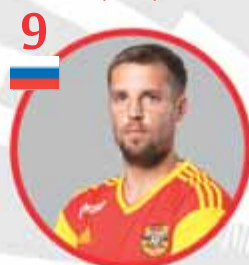
Кирилл Комбаров 22.01.1987 | 182 | 72 Защитник