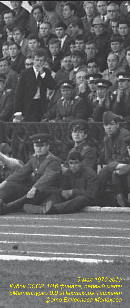
9 мая 1970 года Кубок СССР. 1/16 финала, первый матч «Металлурга» 0:0 «Пахтакор» Ташкент

Каким был футбол в Туле в советскую эпоху? Если говорить о зрительском интересе, то в лучшие сезоны стадион нередко заполнялся под завязку.