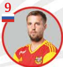
Кирилл Комбаров 22.01.1987 | 182 | 72 Защитник